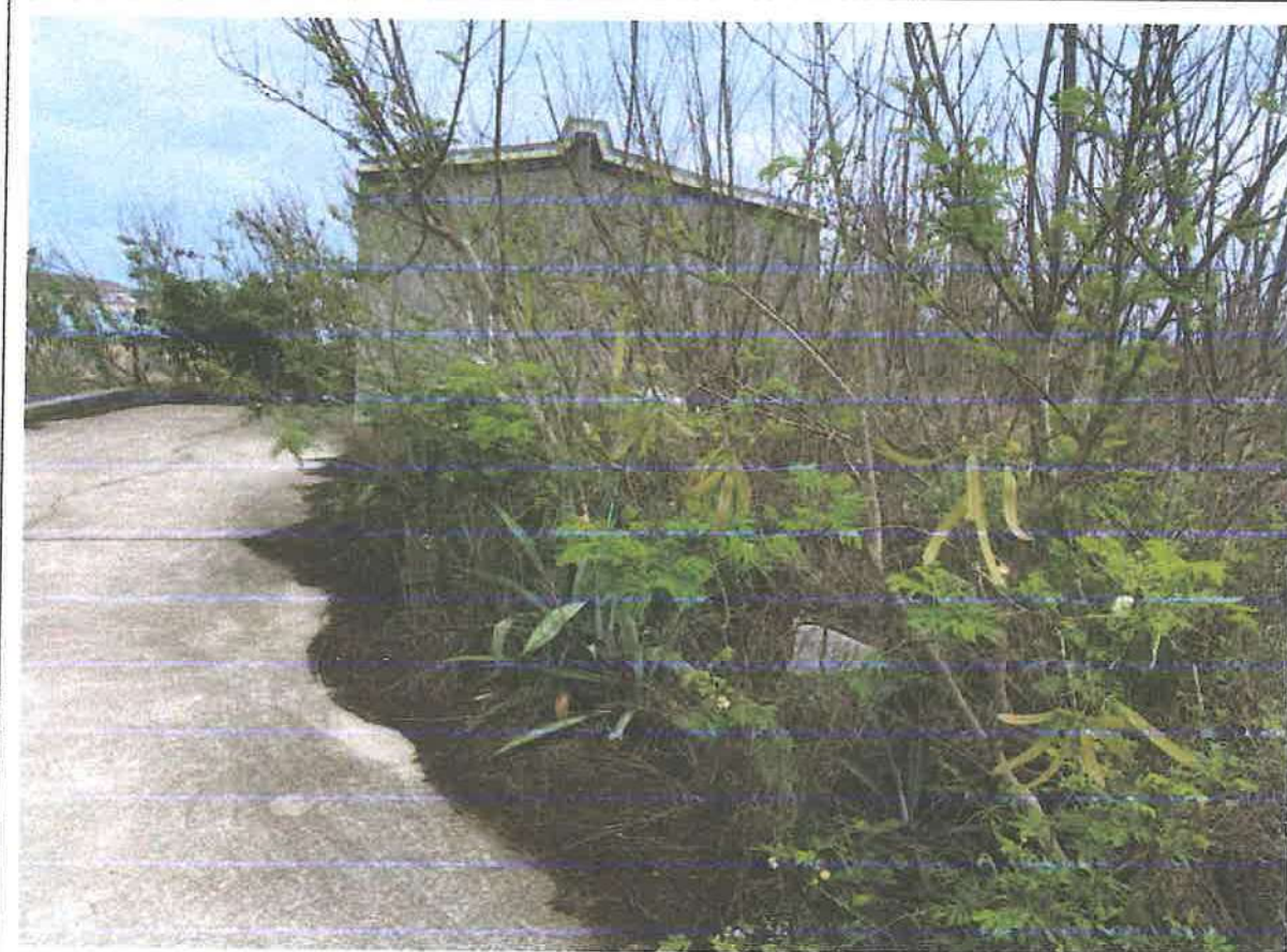
馬公市井垵西段地號 886 土地無主孤墳現場照片